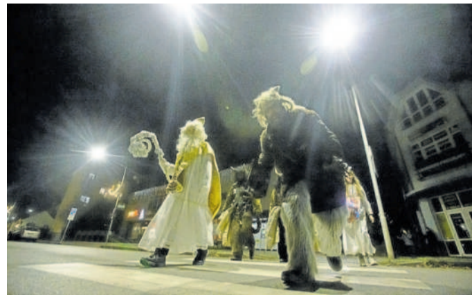
KORONAVIRU NAVZDORY. Mikuláš, andělé a čerti navštívili děti na Vysočině.

Podobně jako ona se těšily děti po celé Vysočině. Jakmile se ale v chodbě ozvalo řinčení řetězu a ohlásili se čerti, přepadl je strach. Někdy však nadpozemské bytosti do chodby ani nepřišly. „U ně-